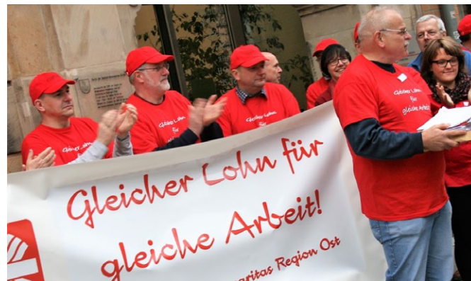
Caritas-Beschäftigte in der Region Ost beteiligen sich an der Aktion „Gleicher Lohn für gleiche Arbeit.“

Mit dem Argument der nahezu flächendeckenden Billiglöhne, hatten die ostdeutschen Bundesländer nach der Wiedervereinigung um Investitionen und wirtschaftliche Neuansiedlungen geworben – mit zweifelhaftem Erfolg. Inzwischen ist der Politik bewusst, dass sich auf diese Weise keine Fachkräfte binden, geschweige denn anwerben lassen. Die Bundesländer im Osten Deutschlands bemühen sich jetzt verstärkt um eine tarifliche Entlohnung. Höchstrichterliche Urteile haben inzwischen eine tarifliche Vergütung als grundsätzlich wirtschaftlich bestätigt.