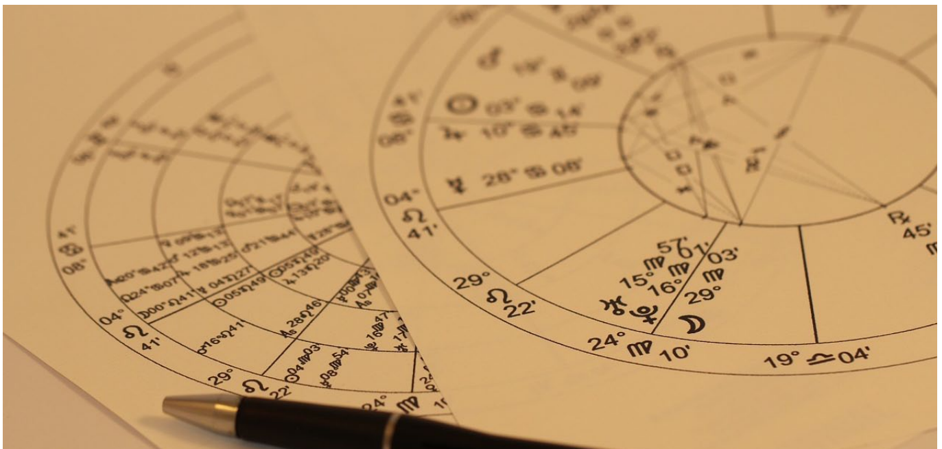
Die Zukunft für die neue Amtszeit lässt sich nicht in den Sternen lesen.