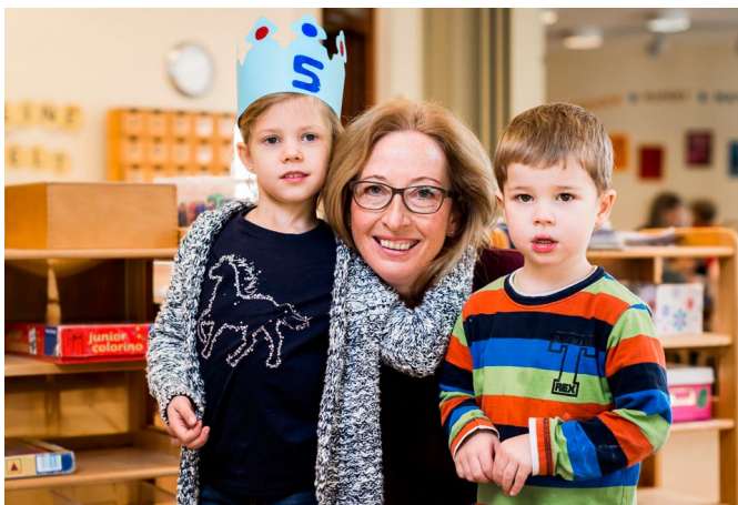
Ein beruflicher Wechsel von einer Caritas-Einrichtung in eine Einrichtung der verfassten Kirche konnte bislang Nachteile mit sich bringen.